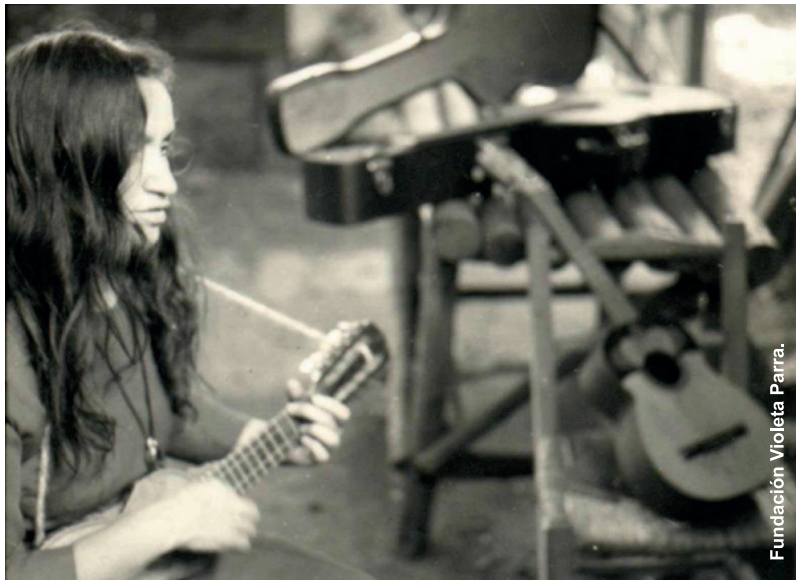
Fundación Violeta Parra.

solo de estos medios de expresión, ¿cuál elegiría usted, si sólo tuviera ese único medio de expresión?- pregunta la francesa Brumagne.