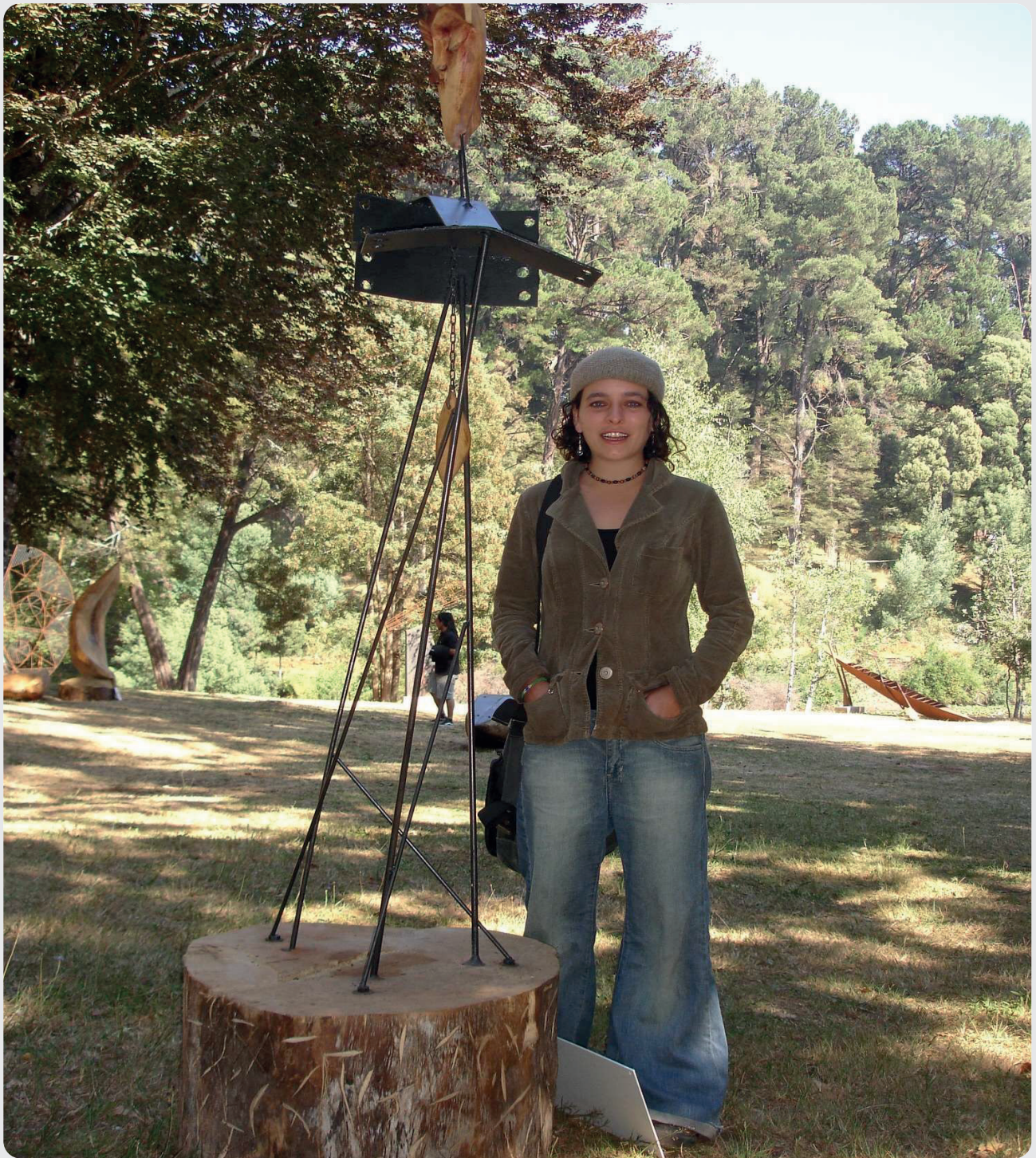
“Palador Arrepentido” Madera y metal