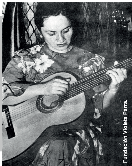
Fundación Violeta Parra.

En Valdivia, el Centro Cultural Violeta Parra celebra el natalicio de la cantora durante todo octubre. Entre las actividades organizadas están la muestra de documentales que incluye la obra de Luis R. Vera Viola Chilensis, proyecciones que se realizarán todo los martes del mes a las 17 horas, en la Biblioteca Municipal Fray Camilo Henríquez. En tanto, con teatro de títeres y música en vivo, la obra titulada La niña Violeta recorrerá los colegios de Valdivia, contando a los escolares los acontecimientos más importantes de la vida de la artista. Más detalles de la programación en cvioletaparra@gmail.com